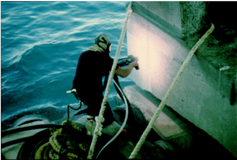
Figure 3. Pulvérisation à l'arc d'une couche de zinc sur un pilier de pont en béton dans les Keys de la Floride. Dans ce cas-ci, le zinc agit comme anode sacrificielle, mais ce métal est plus répandu dans les systèmes à courant appliqué. Trois systèmes à courant appliqué utilisant le zinc ont déjà été installés par le ministère des Transports de l'Ontario, à Toronto.

Les revêtements de zinc métallisé ont aussi ouvert la voie à une nouvelle forme de PC pour les ouvrages en béton armé, la « protection cathodique galvanique ». La PC galvanique est actuellement expérimentée sur quelques ponts dans les Keys de la Floride, à la South Florida University (voir fig. 3) et à l'Institut de recherche en construction du CNRC. Dans un système de PC galvanique, un métal sacrificiel comme le zinc est mis en contact électrique direct avec l'acier en quelques points de raccordement. Le courant est produit par la différence de force électromotrice entre le métal sacrificiel et l'acier. Toutefois, pour qu'un tel système maintienne une polarisation adéquate de l'acier pendant de longues périodes, il faut que la teneur en humidité du béton soit élevée ou que l'enrobage de béton soit le plus mince possible. Cela pourrait être le cas dans plusieurs ouvrages marins et dans certains garages. Il se peut que les systèmes de PC galvanique n'assurent pas une polarisation de l'acier aussi grande que les systèmes à courant appliqué. Toutefois, étant plus simple que les systèmes à courant appliqué, la PC galvanique avec zinc métallisé pourrait devenir une importante technique de remise en état dans l'avenir.