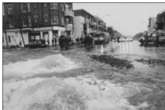
Figure 1. Les fuites d'eau ont pour effet d'endommager le réseau de distribution d'eau (érosion de l'assise des conduites, rupture des canalisations) et les fondations des routes ou des bâtiments.

Les fuites d'eau constituent une perte d'argent et de ressource naturelle précieuse, et elles représentent un danger pour la santé publique. La perte économique principale est le coût de l'eau elle-même, de son traitement et de son transport. Il y a aussi l'endommagement du réseau (érosion de l'assise des conduites, rupture des canalisations) et des fondations des routes ou des