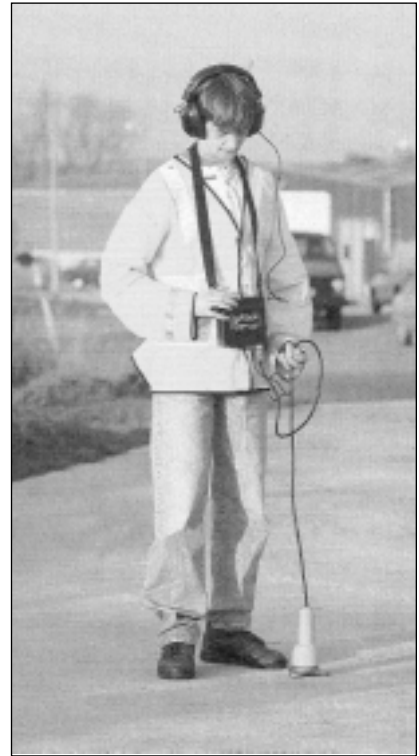
Figure 2. Parmi les appareils d'auscultation typiques se trouvent les tiges d'écoute (gauche) et les microphones au sol (droite).